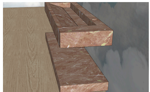
LAVABOS EFECTO MÁRMOL LM-006 UN SENO PARA 2 GRIFOS CON BANCADA